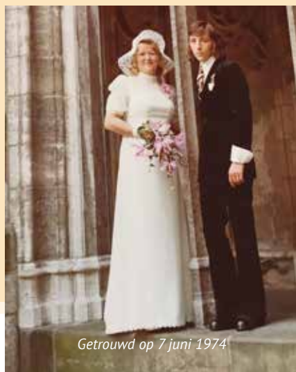
Getrouwd op 7 juni 1974

Voor Foto's-Knipsels-Praatjes over de JUTFASEWEG VAN TOEN en de HISTORIE VAN RIVIERENWIJK.