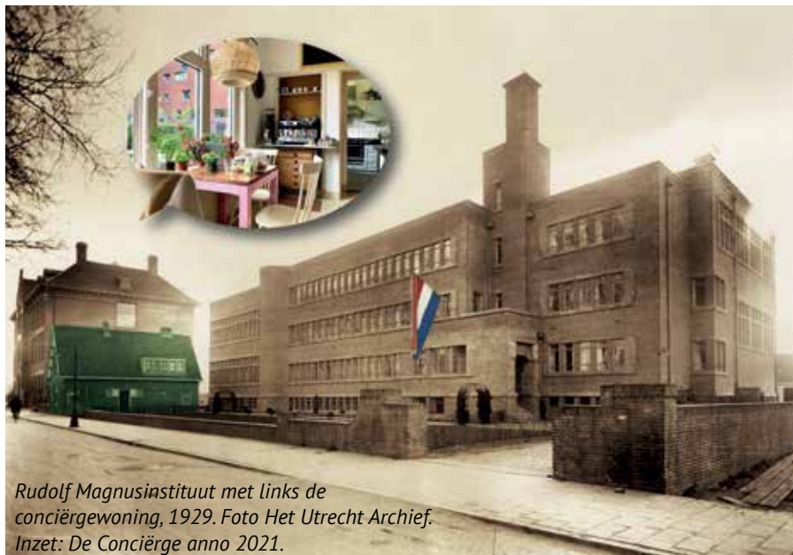
Rudolf Magnusinstituut met links de conciërgewoning, 1929. Inzet: De Conciërge anno 2021.