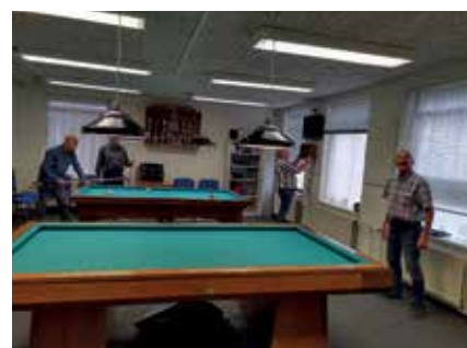
Het biljartlokaal van Buurthuis "De Nieuwe Jutter".