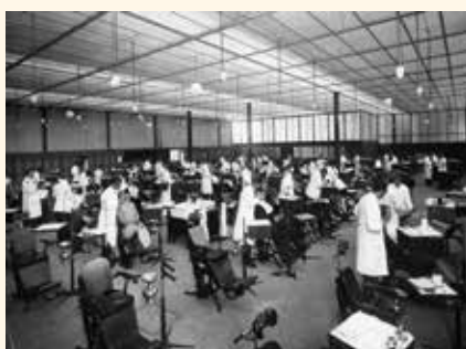
1929 - Tandheelkundig Instituut met op voorgrond Morissenstoelen