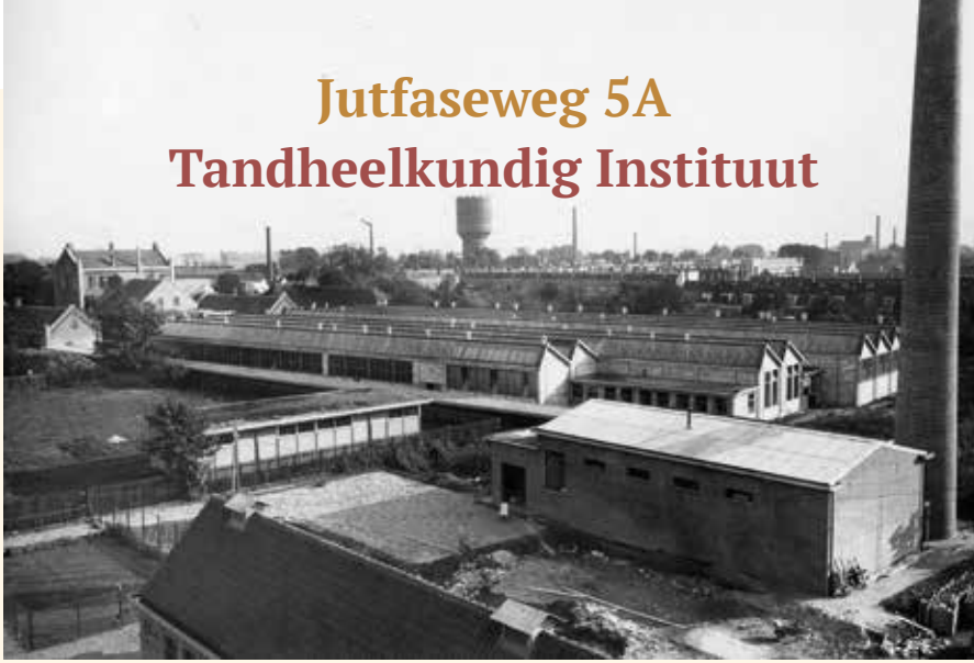
1929 - Jutfaseweg 5A, Tandheelkundig Instituut. Foto onder: 1877 Theodore Dentz oprichter Tandheelkunde

Tandmeesters, zo heetten rondtrekkende mensen die zonder enige opleiding – ruim 140 jaar geleden – tanden en kiezen trokken zonder verdooving. Gelukkig kwam daar verandering in.