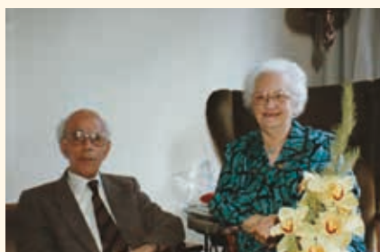
1980 – 40 jaar getrouwd