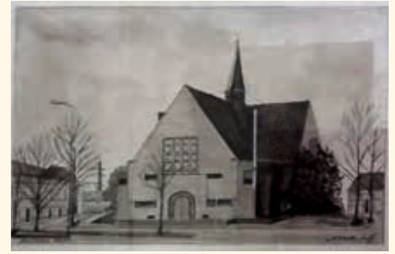
1969 – Schilderij van Julianakerk