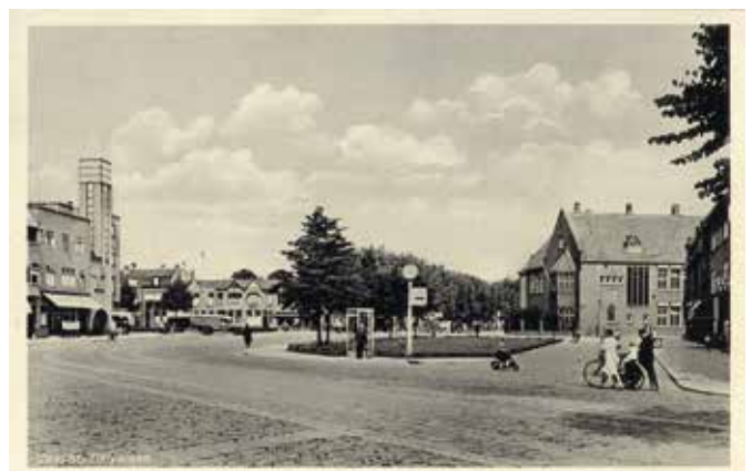
Balijelaan met rechts op de achtergrond de Dr. De Visserschool. 604475

Wil je meedenken over het schrijven van een conceptversie van een moderne en uitvoerbare visie op onze detailhandel inclusief actieve acquisitie met als doel een gezonde langdurige ontwikkeling van het winkelgebied? Ook dan vragen we je ons te mailen voor 15 maart 2023 naar redactie@rivier-dichter.nl