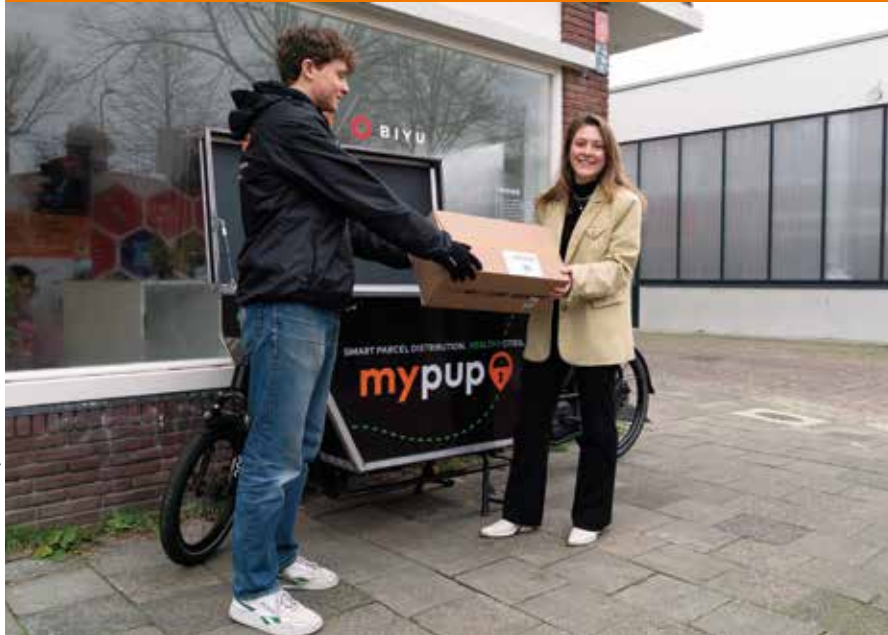
Wethouder Oosters van gemeente Utrecht opent proef met duurzame pakketbezorging