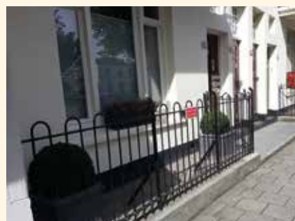
Woonhuis aan de Jutfaseweg 62