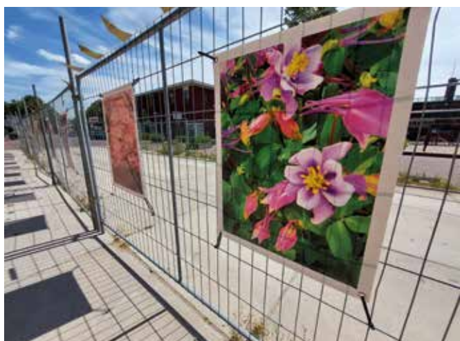
Kleurrijke foto's van deelnemers bij de ingang van de Schipper

De Schipper kent een gemengde woonvorm, dat betekent dat de bewoners in één gebouw met reguliere sociale huurders samenwonen. Om ervoor te zorgen dat bewoners van de Schipper elkaar en hun buurt beter leren