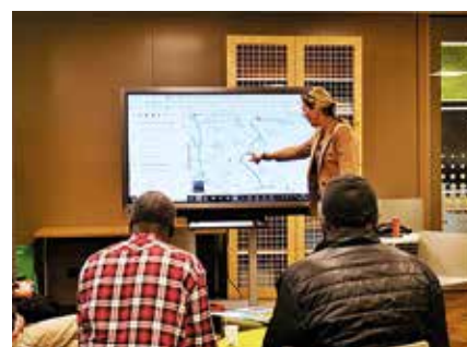
Foto's van links naar rechts, voorlezen, speurtocht en Digi-café in de bieb