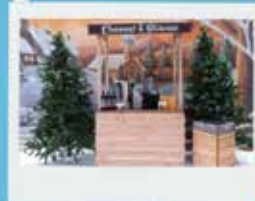
Oliebollen, eten & drinken