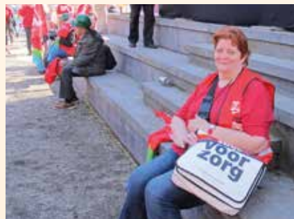
Foto boven: An tijdens een demonstratie voor betere werkomstandigheden