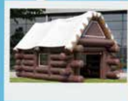
Skihut met silent disco voor kinderen

We zoeken nog mensen die willen helpen! Mail buurthuis@denieuwejutter.nl