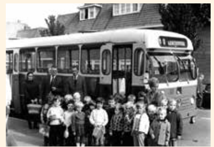
1967: Busreisje kleuters NBM

2013 – In het kader van NL doet. Er wordt een eerste stap gezet met het omtoveren van deze speeltuin naar een groene oase. Er wordt in samenwerking met de Stichting Tafelboom een oude boom uit het Wilhelminapark omgetoverd tot een mooie tafel. Aan de Doetafel worden opgekomen