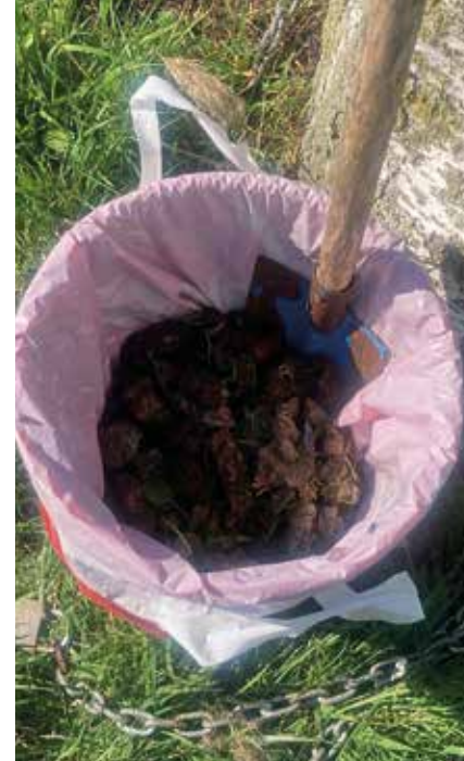
Opbrengst van een middagje scheppen