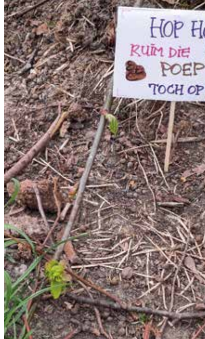
Een van de omwonenden plaatst bordjes bij drollen