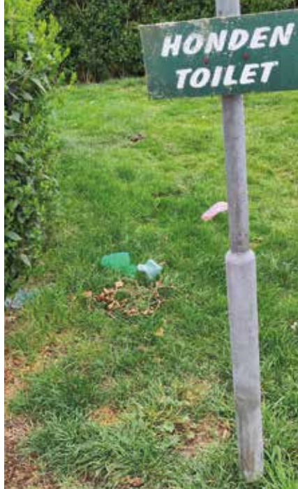
Het hondentoilet wordt wel gebruikt, maar niet altijd op de juiste manier. Vijf meter verderop staat een prullenbak...