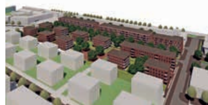
Impressie van het plan Heycopstraat (rechts de Heycopstraat richting Croeselaan op de achtergrond)