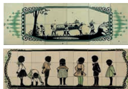
Sneeuwwitje en Zakdoekje leggen