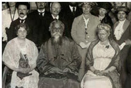
27-09-1920 bezoek aan de Vrije Gemeente Amsterdam

Rabindranath Tagore, geboren te India en Nobelprijswinnaar in 1913, was op zeer veel terreinen actief en had een belangrijk aandeel in de bevrijding van India. Hij was ook pedagoog en stichter van scholen, gaf colleges in verschillende landen, zo ook eenmalig op de Utrechtse universiteit.