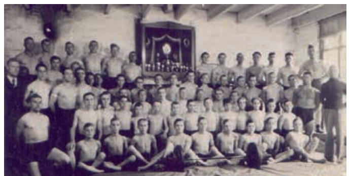
Worstelaars De Halter op zolder in het Kaaspakhuis aan de Lange Nieuwstraat in Utrecht (1943)

Zie voor meer informatie: www.dehalter.nl