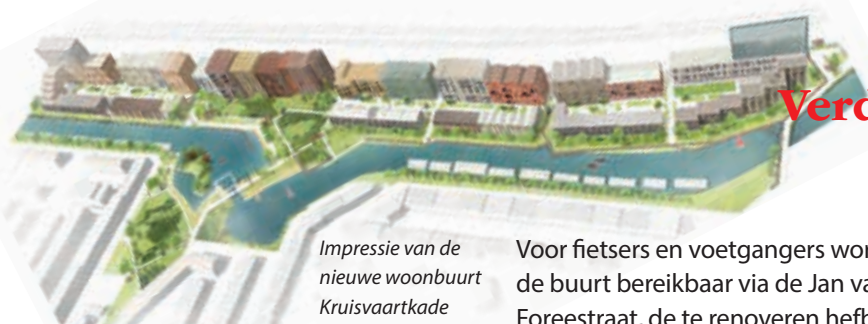
Impressie van de nieuwe woonbuurt Kruisvaartkade