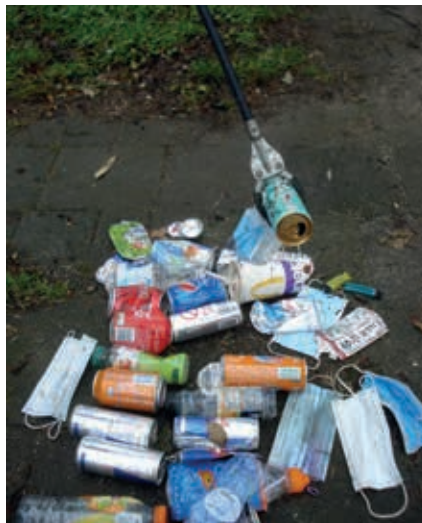
Vooral blikjes en mondkapjes

Dan zou de gemeente dagelijks langs moeten komen, voordat het afval in het riool of in een rivier verdwijnt. Dat kost veel belastinggeld, dat we beter kunnen gebruiken voor mooie dingen zoals schoolgebouwen, zebrapaden en inspraakavonden.