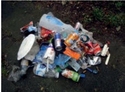
Een half uur afval rapen

Van verschillende buurtbewoners uit de Dichterswijk en de Rivierenwijk kwamen mailtjes binnen over hetzelfde onderwerp. De foto's logen er niet om. Het loopt een beetje de spuigaten uit met het zwerfafval. Vuilnismannen geven aan dat er al een jaar lang goed geklust en opgeruimd wordt door iedereen... en wat niet meer gebruikt kan worden, wordt vaak aan de straat gezet. Afgedankte spullen, maar ook bouwafval, oude deuren, gedumpt door buurtbewoners of zelfs klusbedrijven. Daar moesten we maar eens een item aan wijden.