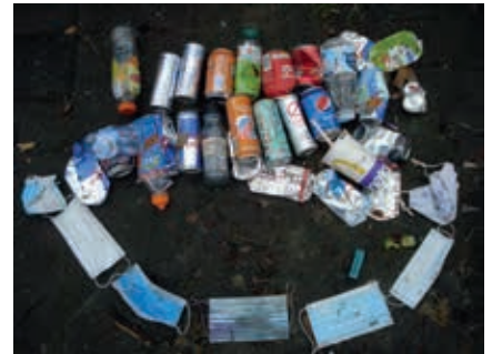
Creatief met afval

Een nieuw fenomeen is het mondkapje, ook wel zwerfkapje genoemd. Er zijn al dode meeuwen gevonden met mondkapjes om hun poten. De Vogelbescherming is bang dat straks tijdens de broedtijd de vogels de kapjes gebruiken als nestmateriaal, en dan verstrikt raken in de elastiekjes. Dus ga ik de laatste tijd extra vaak de straat op, op de foto's het resultaat van een half uurtje rapen. Soms zegt iemand ineens: "goed bezig!". Dat is best leuk. Misschien moeten we dat allemaal wat vaker tegen elkaar zeggen, en zeker tegen eenzame afvalrapers!